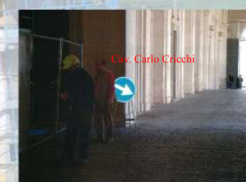
PRESIDENZA DELLA REPUBBLICA - QUIRINALE - Lavori diretti dal Cav. Carlo Cricchi