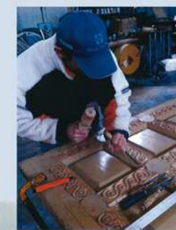
Falegnameria interna all'Impresa e scultore