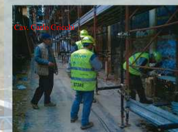
Direzione diretta cantiere puntellamenti centro storico - L'Aquila -