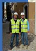
Puntellamento Via Roma Tecnici Impresa